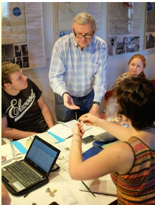
Above: Ambassador Rann with Australian students