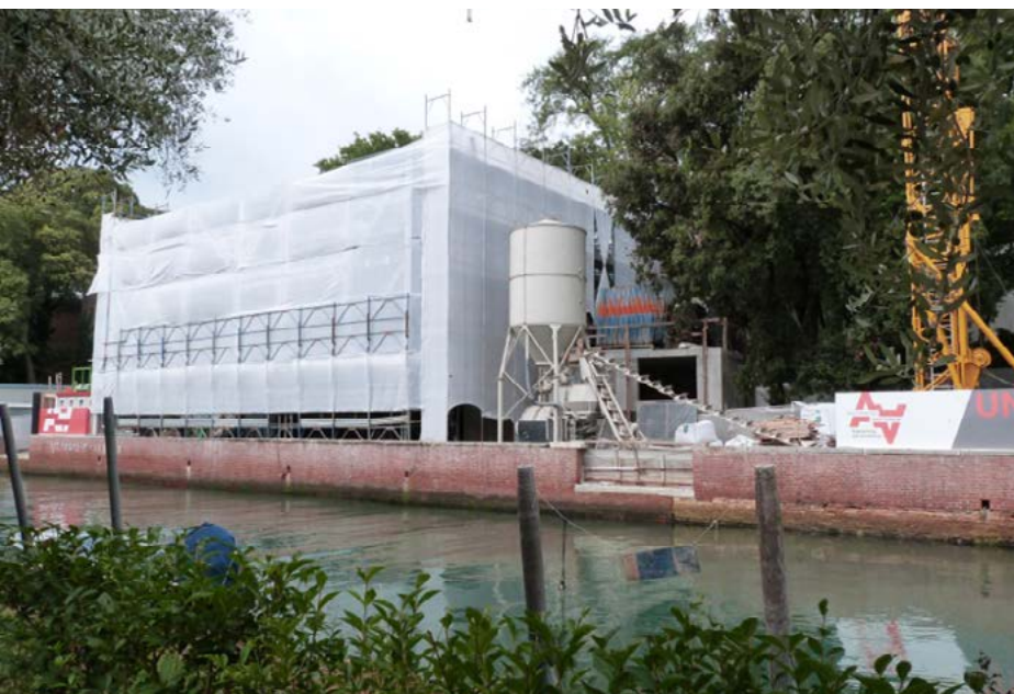
Sopra: il nuovo padiglione australiano

Il nuovo padiglione è concepito come una scatola, ricoperta esternamente da granito nero, al cui interno vi è una scatola bianca che ospita la mostra. La nuova costruzione è stata progettata con fondi sia pubblici sia privati: sono stati raccolti quasi $ 6.5 milioni da 70 famiglie e fondazioni australiane , di cui un milione dal Governo australiano attraverso l'Australia Council for the Arts . Il nuovo padiglione sarà il primo del XXI secolo nella storica località Giardini della Biennale e verrà inaugurato durante la 56ª Mostra Internazionale di Arte, la Biennale di Venezia, a maggio 2015 .